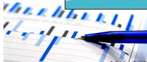
CC18 : Outil d'évaluation des plans d'action (2017).