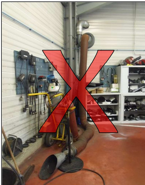
Encombrement au sol = risque de chute de plain-pied